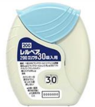
レルベア200エリプタ

* 写真はエリプタの一例であり、実物とは異なる場合があります。 レルベア200エリプタは右上の写真を参照して下さい。