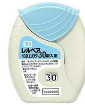
レルベア100エリプタ