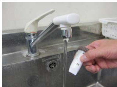
●保管について 写真10