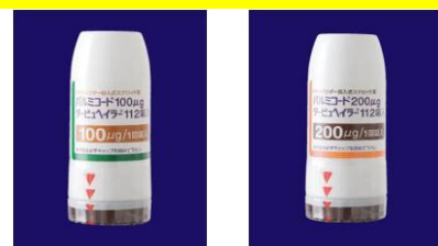
パルミコート100 タービュヘイラー パルミコート200 タービュヘイラー