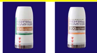
パルミコート100タービュヘイラー パルミコート200タービュヘイラー