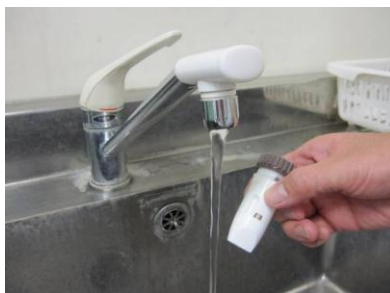
●保管について 写真10