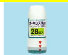
オーキシスタービューヘイラー