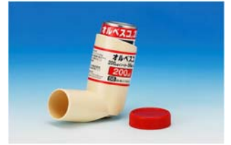
オルベスコインヘラー