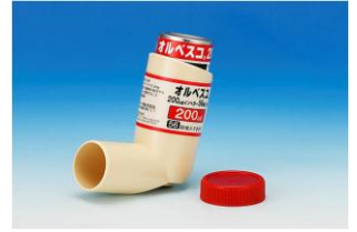
オルベスコインヘラー