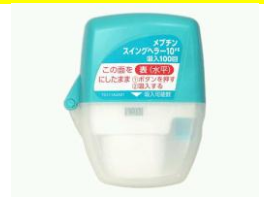
メプチンスイングヘラー