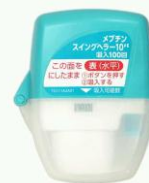
メプチンスイングヘラー