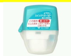
メプチンスイングヘラー