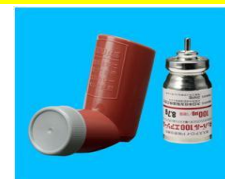
キューバール100エアゾール