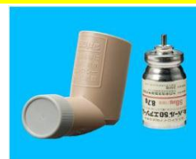
キューバール50エアゾール

* 写真はキューバール50エアゾールです。 キューバール100エアゾールは右上の写真を参照して下さい。