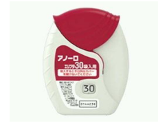
アノーロエリプタ

* 写真はエリプタの一例であり、実物とは異なる場合があります。 アノーロエリプタは右上の写真を参照して下さい。