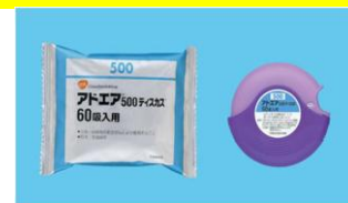
アドエア500ディスクス