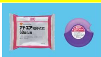
アドエア100ディスクス