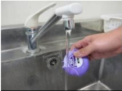
●保管について 写真7