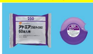
アドエア250ディスクス