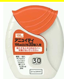
アニュイティ100エリプタ

* 写真はエリプタの一例であり、実物とは異なる場合があります。 アニュイティ100エリプタは右上の写真を参照して下さい。