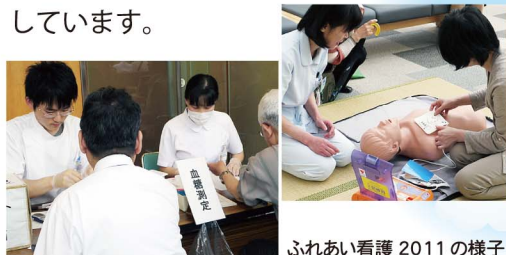
ふれあい看護 2011の様子

今年のふれあい看護は「介護に生かそうりハビリの知識」をテーマに5月10日(木)から12日(土)の3日間行われます。1日看護体験や、毎年人気の健康チェック(血糖・骨密度測定など)、コンサートと楽しい企画が予定されています。皆様のご参加をお待ちしています。