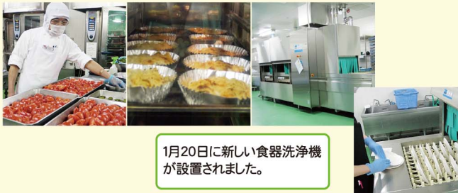
1月20日に新しい食器洗浄機が設置されました。