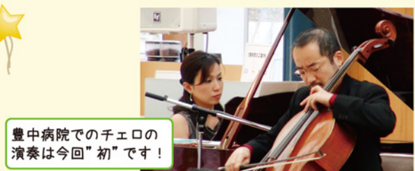
豊中病院でのチェロの演奏は今回"初"です!