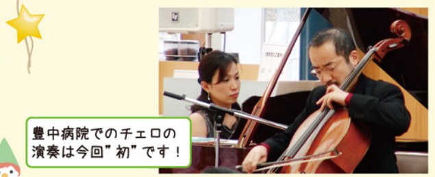
豊中病院でのチェロの演奏は今回"初"です!