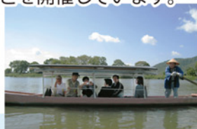
院外研修（平成21年10月） 滋賀県 近江の水郷