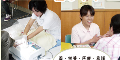
薬・栄養・医療・看護 に関する各種相談

今年の「ふれあい看護」は5月12日から14日まで、 早期検診で、がんは怖くない～チャレンジ！がん検診～を テーマに開催されました。