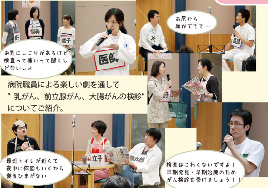
お乳にしこりがあるけど 検査って痛いって聞かし どないしょ