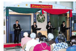
去年のコンサート風景

来る12月21日(日)に毎年恒例となりましたクリスマスコンサートを開催します。職員一同、たくさんの皆さまのご参加をお待ちしております。音楽で心と体をリフレッシュし、楽しいひと時をお過ごしください。