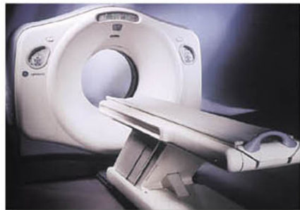
マルチスライスCT装置

豊中病院では、本年4月より最新鋭のマルチスライスCT装置が稼働を開始しました。装置の格段の進歩により高速で広範囲な検査が可能となりました。検査中の息止め時間は、従来のCT装置と比べて1/6から1/10に短縮され、呼吸状態の悪い患者さまでも負担の少ない検査ができます。診断価値の高い、薄い断面像が得られることから、得られた膨大なデータを高性能なコンピュータで処理して、任意の方向から見た断面像、三次元立体画像、血管描出画像などを作成することができます。これらの像は、治療方法の選択や手術での病変への到達方法に重要な情報を提供します。